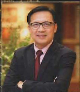
ศ.ดร.สมชาย วงศ์วิเศษ กลุ่ม 1 ภาคกลาง